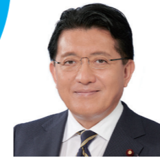
デジタル改革担当 情報通信技術 (IT) 政策担当 兼 スマートシティ戦略部長 (マイナンバー制度) 平井 卓也 氏